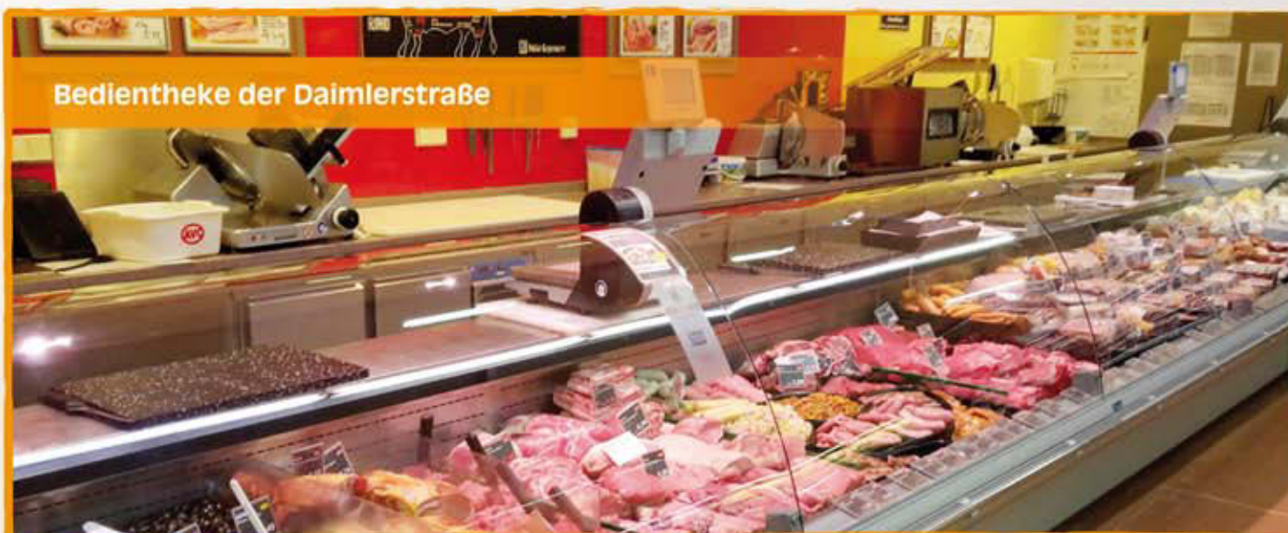
Bedientheke der Daimlerstraße