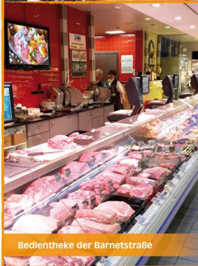
Bedientheke der Barnetstraße