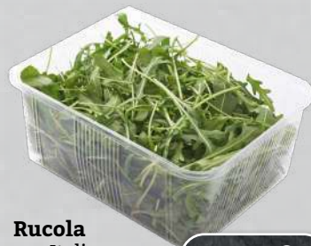
Rucola aus Italien Klasse II 100-g-Schale (1 kg = € 14,90)