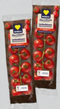
EDEKA Herzstücke Mini-Rispen-tomaten aus den Niederlanden/Belgien Klasse I 400-g-Schale (1 kg = € 4,98)