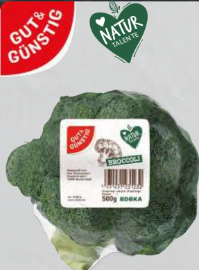
Brokkoli aus Spanien/ Italien, Klasse I 500-g-Packung (1 kg = € 2,98)