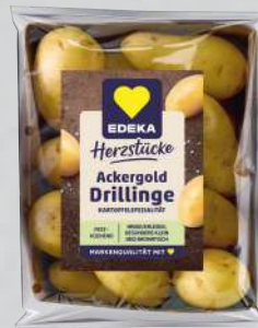
EDEKA Herzstücke Kartoffeln Drilllinge aus Frankreich festkochend Sorte siehe Etikett 1-kg-Schale