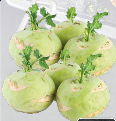
Kohlrabi aus Italien Klasse I, Stück

Aus der Pfanne nehmen, anrichten und servieren.