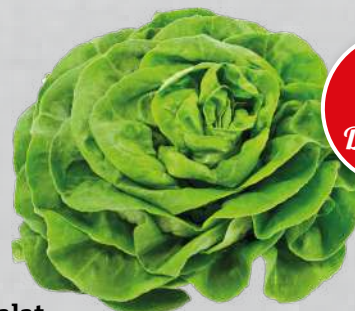
Kopfsalat aus Italien/Belgien Klasse I, Stück