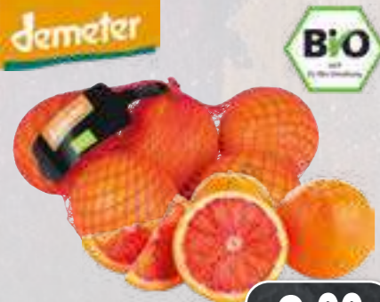
Bio-Blutorangen aus Spanien/Italien Klasse II, 1-kg-Netz