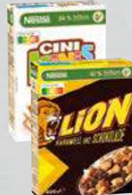
Nestlé Cerealien versch. Sorten je 325- bis 400-g-Packung (1 kg ab € 6,23)