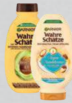
Garnier Wahre Schätze Shampoo oder Spülung versch. Sorten je 250-/200-ml Flasche (1 Liter ab € 7,96)