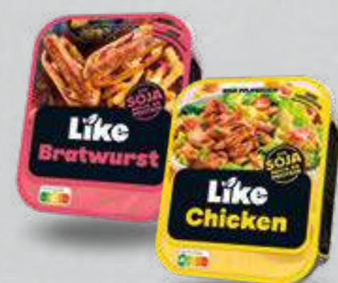
Like Meat vegane Fleischalternativen versch. Sorten je 175- bis 200-g-Packung (1 kg ab € 12,45)