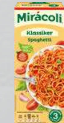
Mirácoli Spaghetti Tomate 376-g-Packung (1 kg = € 5,29)