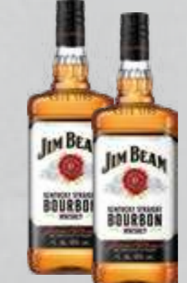
Jim Beam Spirituosen 40/32 % Vol. versch. Sorten je 0,7-l-Flasche (1 Liter = € 15,70)