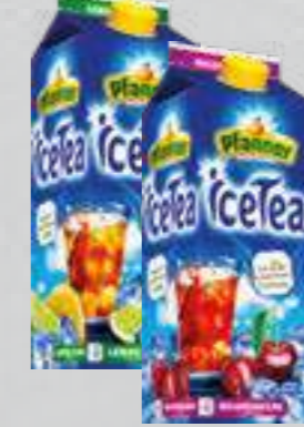
Pfanter Eistee versch. Sorten je 2-l-Packung (1 Liter = € 1,00)