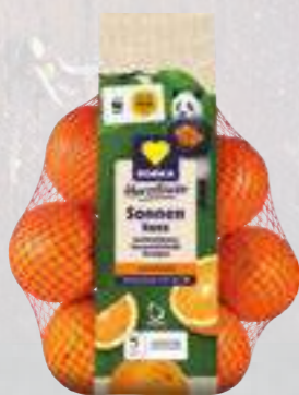
Orangen aus Spanien Klasse I 1,5-kg-Netz (1 kg = € 1,99)