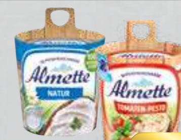
Hochland Almette Frischkäse versch. Sorten und Fettstufen je 140-/150-g-Becher (1 kg ab € 6,60)