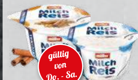
Müller Milchreis versch. Sorten je 180-/200-g-Becher (1 kg ab € 1,95)