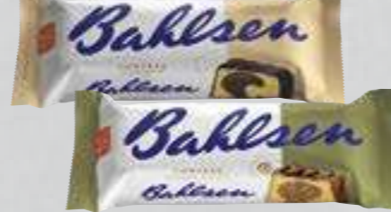
Bahlsen Comtess versch. Sorten je 350-g-Packung (1 kg = € 5,11)