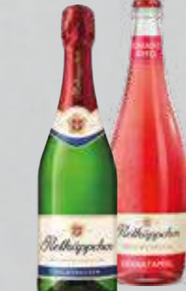
Rotkäppchen Sekt oder Fruchtsecco versch. Sorten je 0,75-l-Flasche (1 Liter = € 3,99)