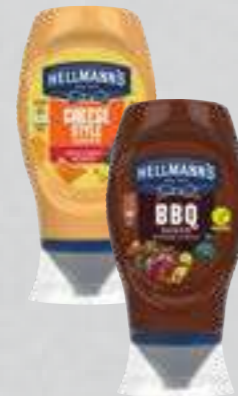
Hellmann's Saucen versch. Sorten je 250-ml-Flasche (1 Liter = € 5,96)