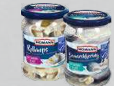
Homann MSC Fischspezialitäten versch. Sorten je 460-/500-g-Glas (1 kg ab € 5,98)