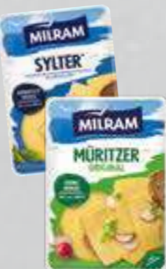
Milram Scheiben- oder Reibekäse versch. Sorten und Fettstufen je 150-g-Packung (1 kg = € 10,60)