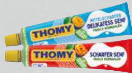
Thomy Delikatess-Senf versch. Sorten je 200-ml-Tube (1 Liter = € 4,95)

Nur erhältlich in EDEKA-Kunzler Märkten!