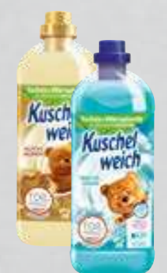
Kuschelweich Weichspüler versch. Sorten je 0,75- bis 1-l-Flasche (1 Liter ab 1,49)