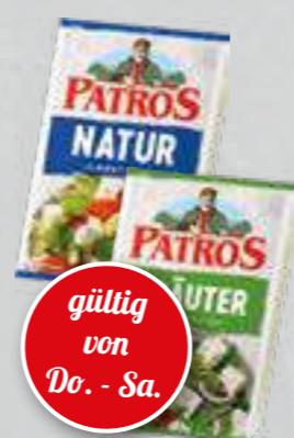
Patros Fetakäse versch. Sorten und Fettstufen je 135- bis 180-g-Packung (1 kg ab € 9,94)