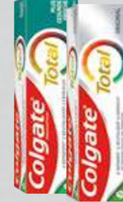
Colgate Zahncreme versch. Sorten je 75-ml-Tube (1 Liter = € 19,87)