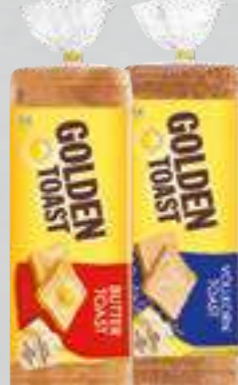
Golden Toast versch. Sorten je 500-g-Packung (1 kg = € 2,58)