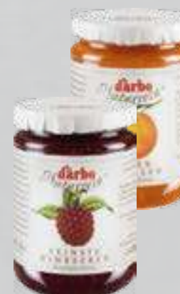
Darbo Konfitüre versch. Sorten je 450-g-Glas (1 kg = € 6,64)