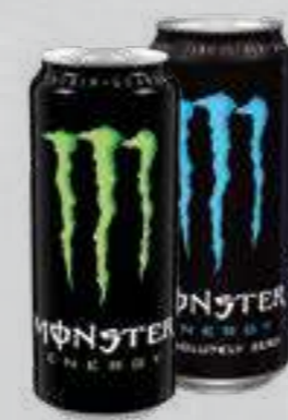
Monster Energy-Drink versch. Sorten je 0,5-l-Dose + € 0,25 Pfand (1 Liter = € 1,98)