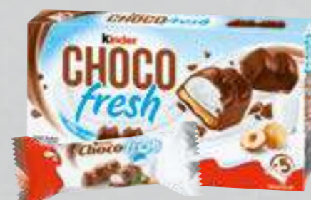
Ferrero Kinder Choco Fresh 102,5-g-Packung (1 kg = 17,46)