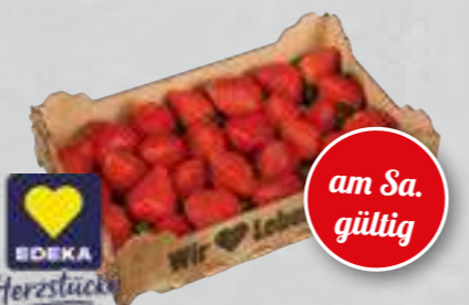
Geschmacks-erdbeeren aus Spanien/Griechenland Klasse I, 800-g-Kiste (1 kg = € 6,24)