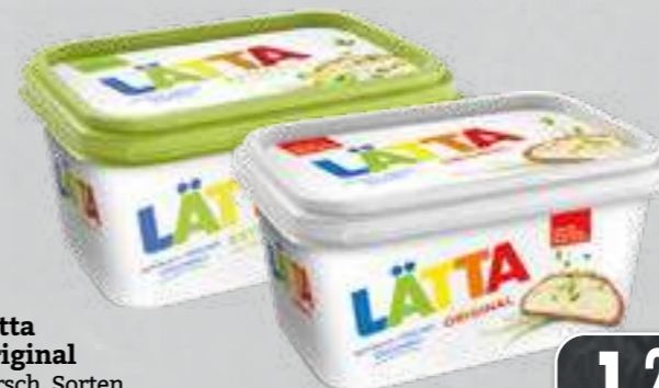
Lätta Original versch. Sorten je 450-g-Packung (1 kg = € 2,87)