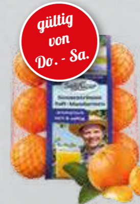
Mandarinen aus Spanien Klasse I 750-g-Netz (1 kg = € 3,32)