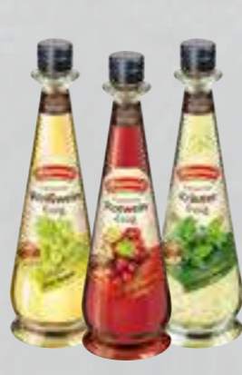
Hengstenberg Essig oder Balsamico versch. Sorten je 0,5-l-Flasche (1 Liter = € 5,98)