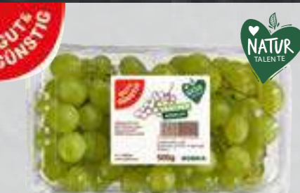
Trauben hell aus Südafrika/Namibia kernlos, Klasse I 500-g-Schale (1 kg = € 3,98)