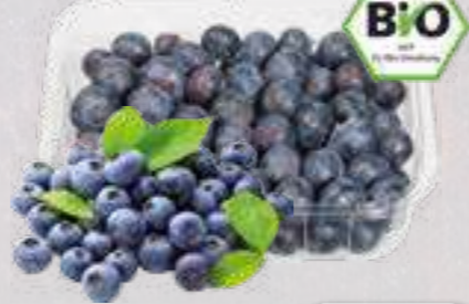
Bio-Heidelbeeren aus Chile/Peru Klasse II, 300-g-Schale (1 kg = € 13,30)