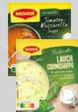
Maggi Suppen versch. Sorten für 500 bis 750 ml (1 Liter ab € 0,99) je Packung