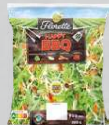
Florette Salatmischung Happy BBQ 300-g-Packung (1 kg = € 6,63)