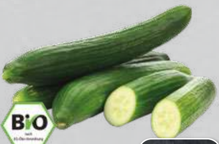
Bio-Gurken aus Spanien Klasse II, Stück