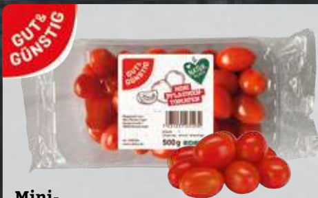
Mini-Pflaumtomaten aus Marokko/Spanien Klasse I, 500-g-Schale (1 kg = € 2,98)