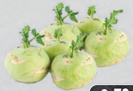
Kohlrabi aus Italien Klasse I, Stück