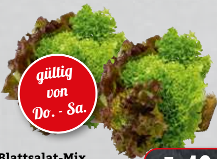
Blattsalat-Mix mit Wurzelballen aus den Niederlanden/ Belgien, Klasse I, Stück