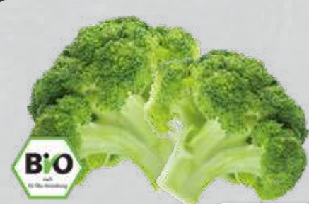
Bio-Brokkoli aus Spanien/Italien Klasse II, 400-g-Packung (1 kg = € 4,98)