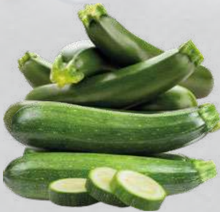
Zucchini aus Spanien/Marokko Klasse I, 1 kg