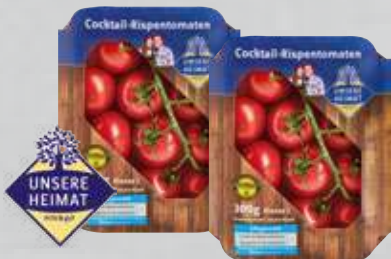
Cocktail-Rispentomaten aus Deutschland Klasse I, 300-g-Packung (1 kg = € 9,97)