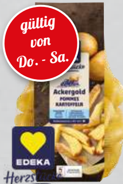
Speisekartoffeln aus Ägypten versch. Sorten 2-kg-Packung (1 kg = € 1,50)