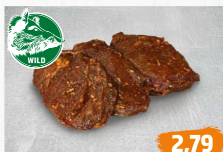
WILDSCHWEINKEULEN- SCHWENKER nach saarl. Art herzhaft gewürzt, €/100g