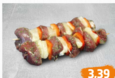
LAMMHÜFTE natur oder nach Gyros-Art mariniert, oder LAMMHÜFTSPIESSE , €/100g