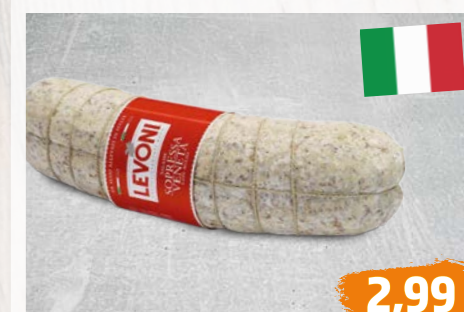
SOPRESSA VENETA original italienische, luftgetrocknete Salamispezialität, €/100g