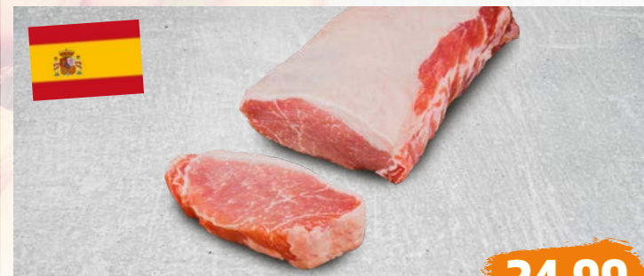
IBÉRICO SCHWEINERÜCKEN vom galizischen Schwein, nussiges Aroma, natur oder gewürzt, €/kg