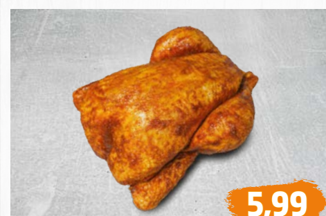
BRATHÄHNCHEN zart und saftig, natur oder grillfertig gewürzt, Handelsklasse A, €/kg