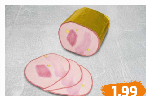
PASTETEN-AUFSCHNITT von Höll, verschiedene Sorten, €/100g