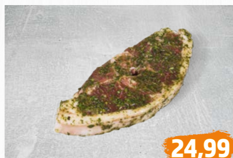
LAMMKOTELETT natur oder grillfertig gewürzt, €/kg