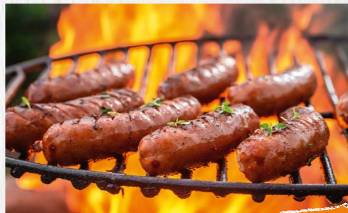
GRILLWÜRSTCHEN-PARADE verschiedene Sorten: WEISS, ROT, PIZZA, SCHWENKBRATENART, TOMATE-MOZZARELLA, SPINAT-KÄSE, KÄSE-CHILI oder KÄSE, €/100g