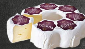
FIGORELLA DI TOMINO • mind. 68% Fett i. Tr.