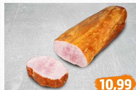
KAISERBRATEN vom Schweinerücken, mild gesalzen, gold-gelb geräuchert, €/kg