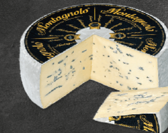
MONTAGNOLO • Blauschimmel-Weichkäse • mind. 70% Fett i. Tr.