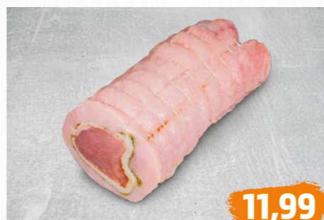
SCHLEMMERROLLBRATEN aus dem Schweinerücken mit eingelegtem Schweinefilet, €/kg