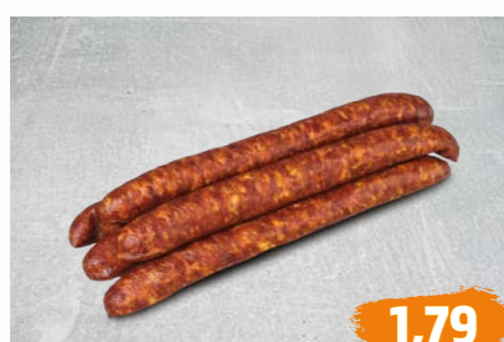
ROHESSER rauchfrisch, zart im Biss, herzhaft und einmalig würzig im Geschmack, €/100g