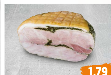
KOCHSCHINKEN nach Prager Art, besonders saftig, mild im Geschmack, €/100g