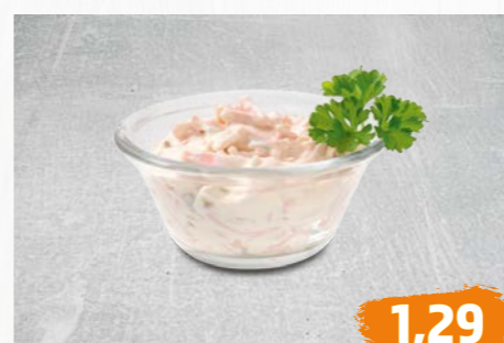
FLEISCHSALAT hausgemacht, aus eigener Herstellung, mit bester Mayonnaise, €/100g