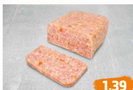
HAUSMACHER SÜLZE / SCHWEINSKÄSE nach saarländischer Rezeptur, €/100g