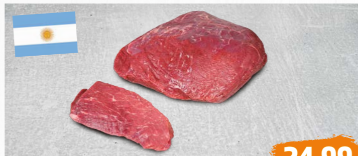
ARGENTINISCHE RINDERHÜFTSTEAKS oder -BRATEN, gut abgehangen, zart und mager, €/kg