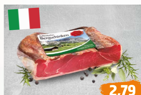
ITALIENISCHER BERGSCHINKEN ohne Schwarte, luftgetrocknet, €/100g