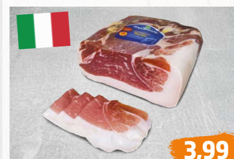
PARMASCHINKEN RISERVA original italienische Schinkenspezialität, luftgetrocknet, €/100g