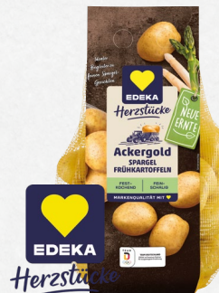
Speisekartoffeln aus Ägypten versch. Koch-eigenschaften 2-kg-Netz (1 kg = € 1,50)