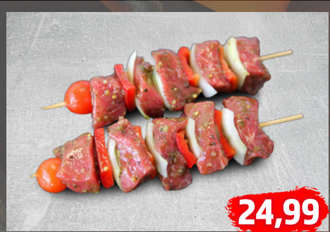
RINDERHÜFTSPIESSE gut abgehangen, auf Wunsch grillfertig gewürzt, auf dem Grill ein Genuss, €/kg