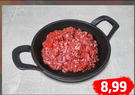
HACKFLEISCH gemischt, vom Rind und Schwein, laufend frisch hergestellt, €/kg