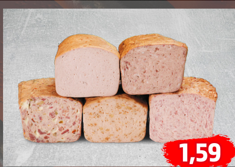
FLEISCHKÄSE-AUFSCHNITT ofengebacken, alle Sorten, für eine gute Brotzeit, €/100g