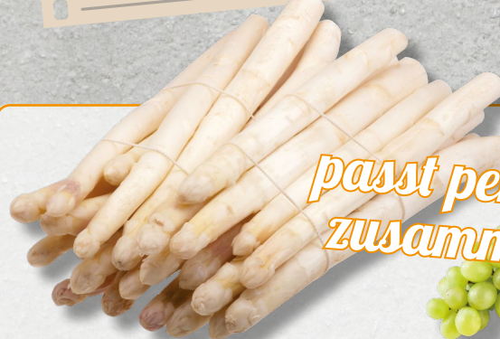
Spargel aus der Region