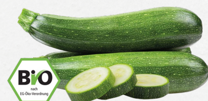
Bio-Zucchini aus Spanien/Italien Klasse II, 500-g-Bund (1 kg = € 2,98)