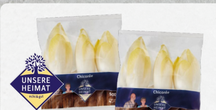
Chicorée aus Deutschland Klasse I, 500-g-Packung (1 kg = € 3,98)