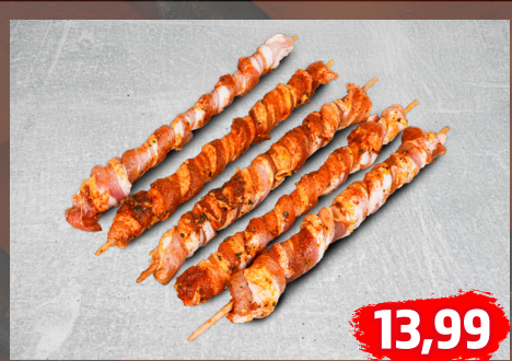
GRILLFACKELN aus dem saftigen Schweinebauch, herzhaft gewürzt, €/kg