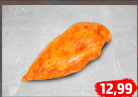
HÄHNCHENBRUSTFILET natur oder mariniert, lecker und eiweißreich, Handelsklasse A, €/kg