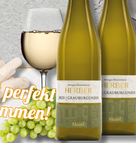
Herber Grauburgunder 0,75-l-Flasche (1 Liter = € 10,60)