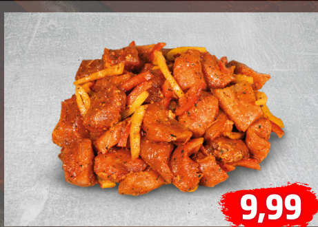
SCHWEINE- oder PAPRIKA-GULASCH aus dem Schweineschinken, natur oder gewürzt, €/kg