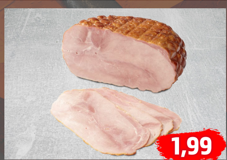
HONIGSCHINKEN mit Honig verfeinert, sehr mager, €/100g