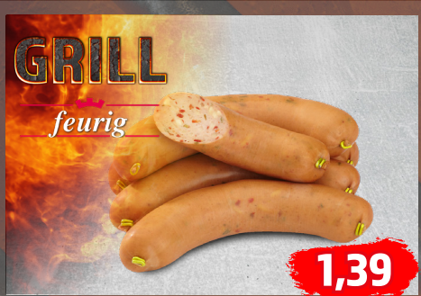
KÄSE-CHILI-LYONER würzig scharf, 200-g-Stücke, oder KÄSEFLEISCHWURST , €/100g