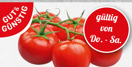
Rispen Tomaten aus den Niederlanden/Belgien, Klasse I, 1 kg