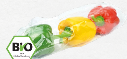
Bio-Paprika-Mix aus Spanien, Klasse II 400-g-Packung (1 kg = € 6,23)