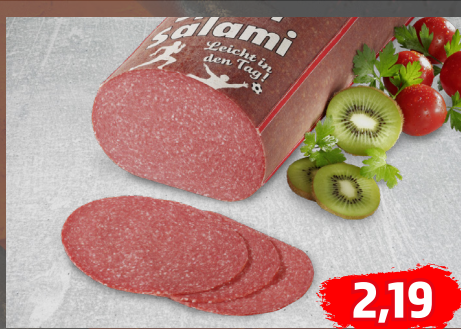
SPORTSALAMI leicht in den Tag, fettreduziert, aus Truthahn- und Schweinefleisch, €/100g