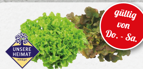
Kraussalat oder Eichblatt rot aus Deutschland Klasse I, je Stück