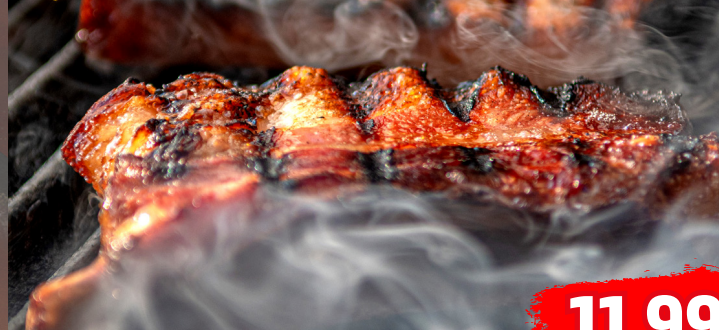
SPARE RIBS ideal vom Grill oder aus dem Ofen, grillfertig mariniert, vorgegart, €/kg