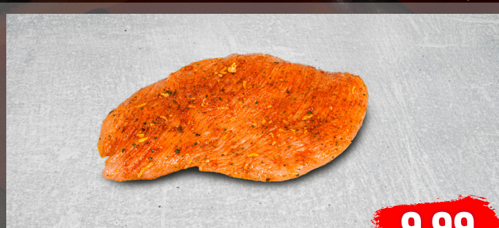
SCHNITZELSCHWENKER aus dem Schweineschinken, herzhaft gewürzt, ideal für auf den Grill, €/kg